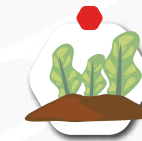
Te veel blad? Verzamel het overige blad op een plek. Laat het composteren