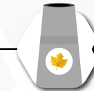
Blad verdwijnt uit de wijk